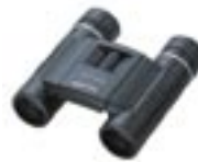
10 x 25 DCF MCII