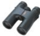
DCF HS 10 x 36