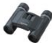
8 x 25 DCF MCII

Den kompakten DCF MCII-Modellen sieht man ihre Vielseitigkeit sofort an. Das ansprechende Design kann sich überall sehen lassen, wo es etwas zu beobachten gibt. Kompakte Abmessungen und geringes Gewicht dank Innenfokussierung tun ihr übriges.