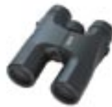
DCF HS 8 x 36

Die Prismen der DCF HS Serie besitzen eine hochwertige Vergütung gegen unerwünschte Reflexe und erzeugen so besonders helle und klare Bilder. Die Ferngläser sind wasserdicht nach den Anforderungen der Klasse JIS 4. Ihre Stickstofffüllung verhindert das Beschlagen der Linsen. Die gummierte Gehäuseausführung macht sie zu sehr robusten Begleitern, die auch Schmutz und Stöße verzeihen. Der von PENTAX entwickelte Aufbau der Innenfokussierung erlaubt ein besonders geringes Gewicht.